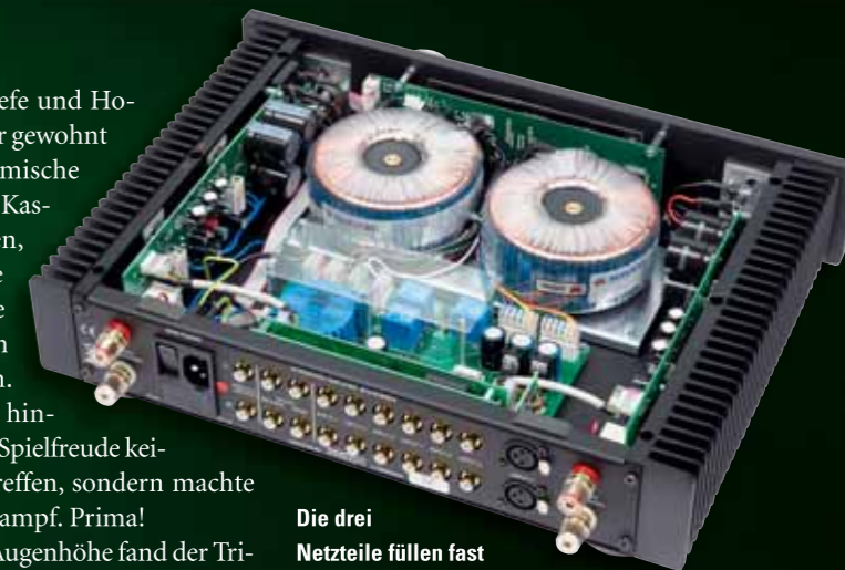
Die drei Netzteile füllen fast den gesamten Energy. Die Endstufen sitzen seitlich, innen an den Kühlkörpern

Einen Gegner auf Augenhöhe fand der Trigon erst im Marantz-Boliden PM-11S2 (um 3500 Euro). Der hat nicht nur scheinbar end-