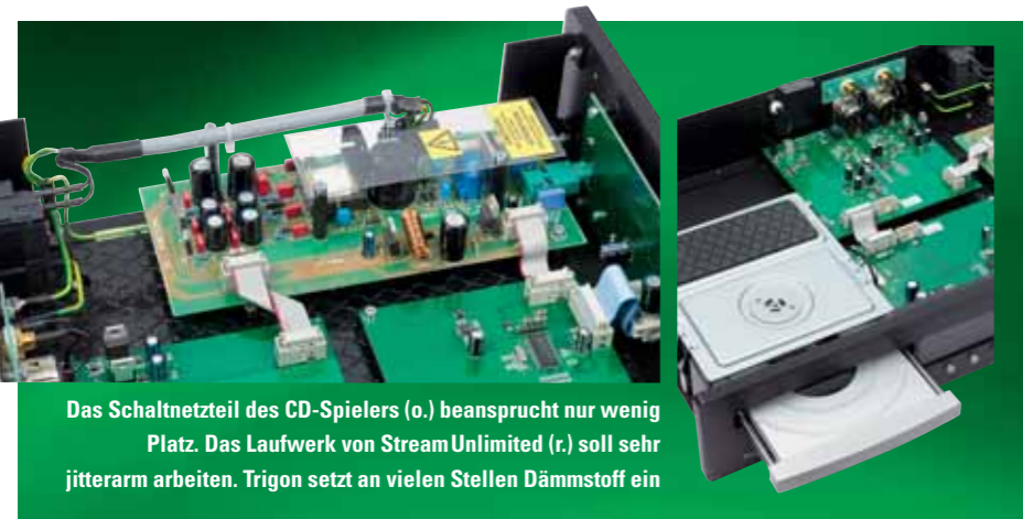
Das Schaltnetzteil des CD-Spielers (o.) beansprucht nur wenig Platz. Das Laufwerk von StreamUnlimited (r.) soll sehr jitterarm arbeiten. Trigon setzt an vielen Stellen Dämmstoff ein

wird der Vanguard II mit dem optionalen Akku-Netzteil Volcano II (ab 390 Euro), das ihm die Gelöstheit, Homogenität, Weiträumigkeit und geschmeidige Eleganz verleiht, die ihm mit dem mitgelieferten externen Versorger fehlen. Dann war er kaum noch von der klangstarken integrierten Phonostufe in Soulutions Vorverstärker 720 zu unterscheiden und empfiehlt sich folglich auch für sehr hochwertige Plattenspieler.