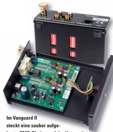
Im Vanguard II steckt eine sauber aufgebaute SMD-Platine, auf der Unterseite sorgen „Mäuseklaviere“ für hohe Flexibilität

Klanglich passt Trignons Phono-Pre voll ins Konzept, spielt offen, farbig und druckvoll. Er hat mehr Elan und Auflösung als Audiobalbs 8000 PPA und erinnert mit seiner quirligen, aber gut sortierten Gangart stark an Clearaudios Smartphono. Zum Überflieger